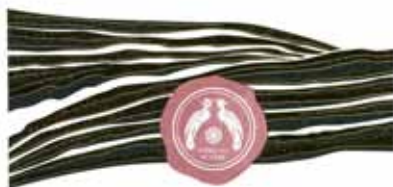
Voskeviz, Aragatsotn region Armenia

(526) Բոլոր գրառումները բացի «VOSKEVAZ» բառից և «VOSKEVAZ WINERY» արտահայտությունից ինքնուրույն պահպանության օբյեկտներ չեն: